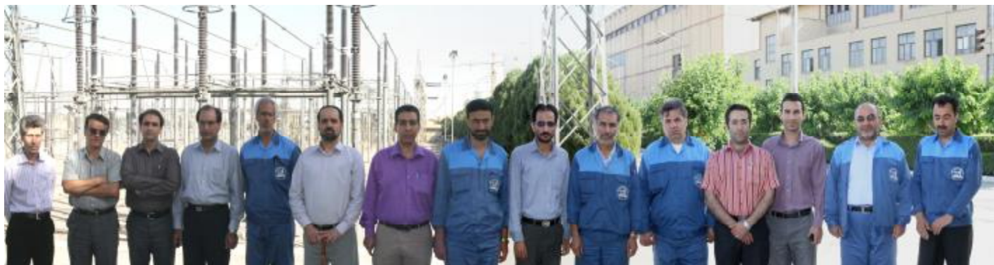
همکاران معاونت مهندسی و دفتر نظارت فنی